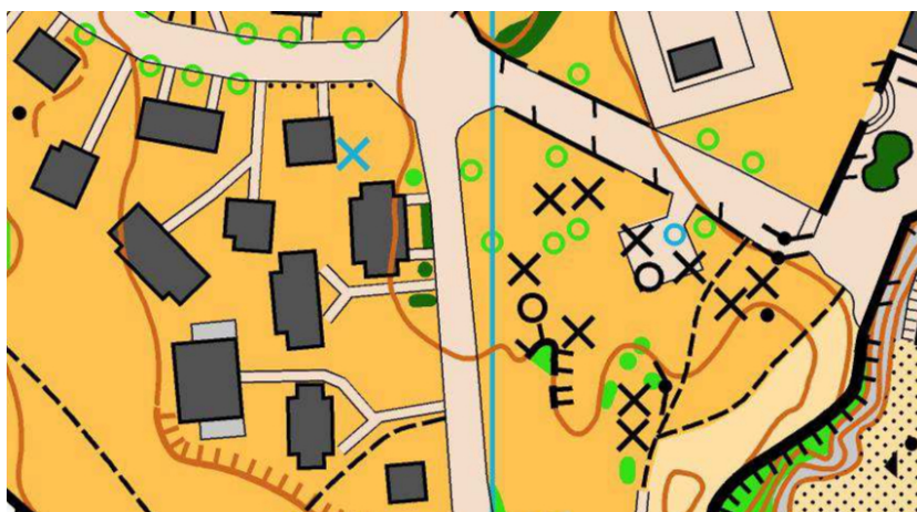
Ejemplo del mapa de carrera

LA ESCALA DEL MAPA SERÁ 1:5000. LA EQUIDISTANCIA ES DE 5 METROS.